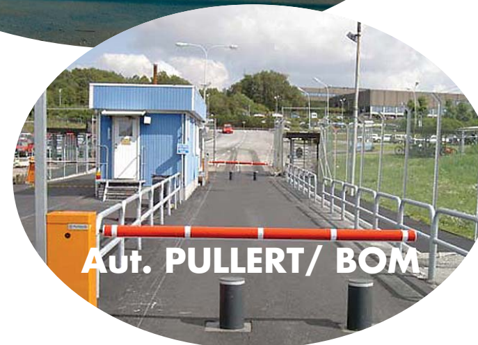
Aut. PULLERT/ BOM